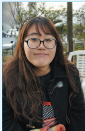
人间文化学院 日本语言文学系2年级

在研究生院，除了上课，还通过帮助老师做各种各样的工作，积累了宝贵的经验。除了搞研究，为了接触日本的社会和挣些零花钱也在打工，这样可以亲身感受现在的日本，生活非常充实。