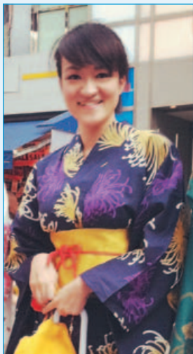
研究生院 生活机构研究科 环境设计研究专业 硕士2年