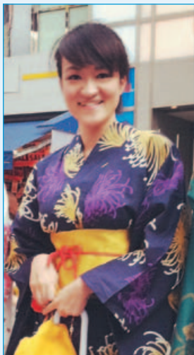
研究所 生活機構研究科 環境設計研究專業 碩士2年